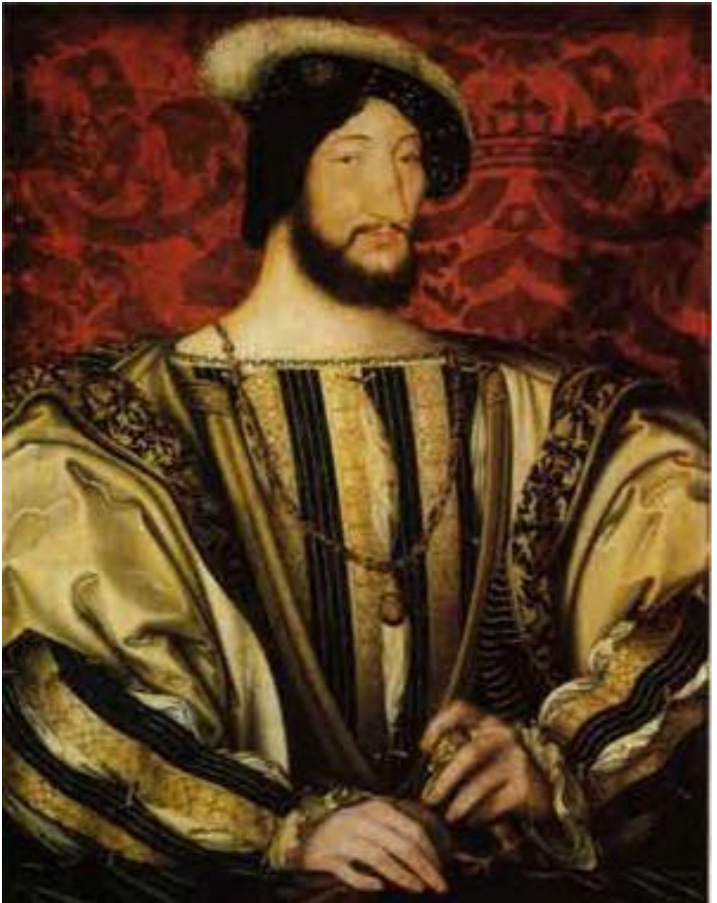
François I er , roi de France de 1515 à 1547. Il protégeait les artistes. Il a fait venir d'Italie Léonard de Vinci , (portrait de Jean Clouet, 1530)