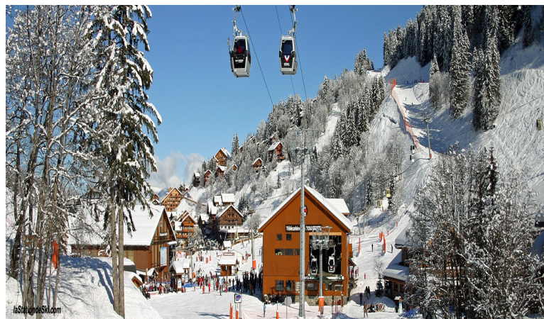
Station de ski de Méribel ( Savoie, Alpes )