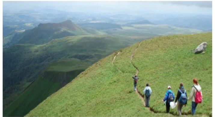
Les volcans d'Auvergne