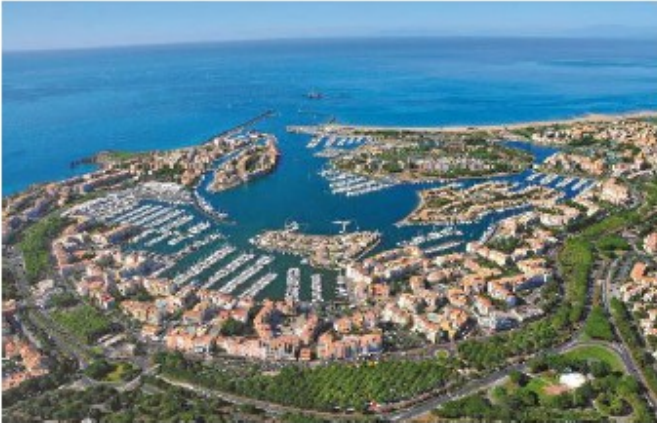
La plage du Cap d'Agde