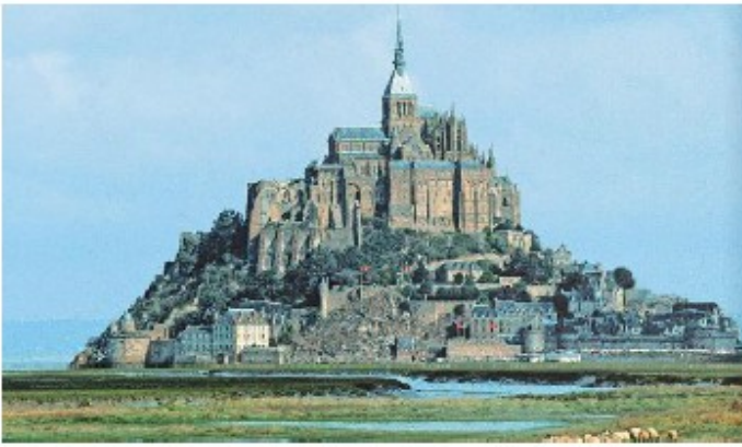
Le mont Saint-Michel