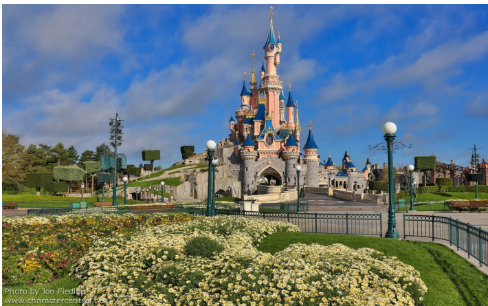
Parc Disneyland ( Seine et Marne )