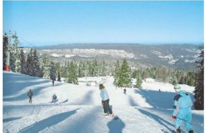
La station des Rousses (Jura)