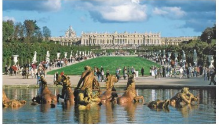
Le château de Versailles