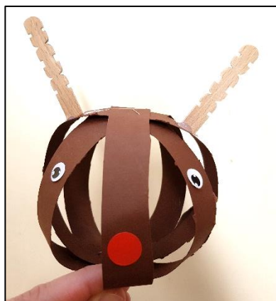
Boule en forme de renne avec les MS : Découpage de bandes de papier et collage de gommettes