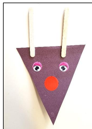
Renne à suspendre avec les PS : Collage de gommettes